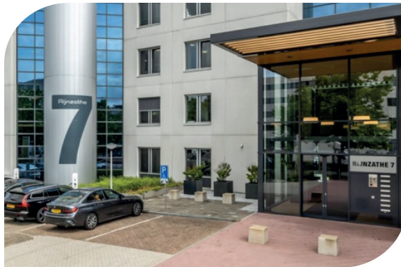
Het eerste pand op de Rijnzathe in de Meern.

We geloven dat als de basis goed is, er ruimte is om Passie voor je vak te ontwikkelen. Dan zijn Prestaties haast vanzelfsprekend en heb je Plezier in wat je doet. Door jezelf en je team te blijven door ontwikkelen haal je het beste uit jezelf. Daarbij is het noodzakelijk dat je blijft werken aan je vitaliteit en je gezondheid.