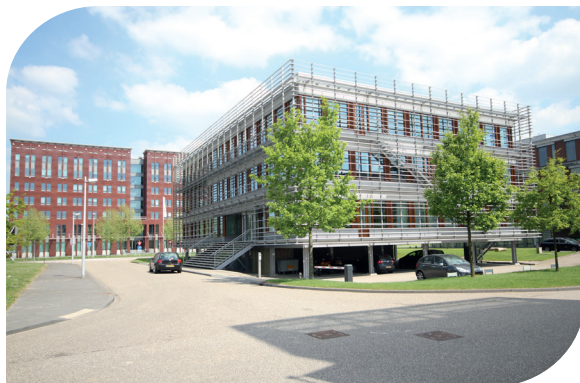
Het nieuwe pand op de Janssoniuslaan in Papendorp.

We zijn als vreemde eend binnen de Caesar Groep met negen teamleden verantwoordelijk voor de helft van de omzet. Daar zijn we trots op!