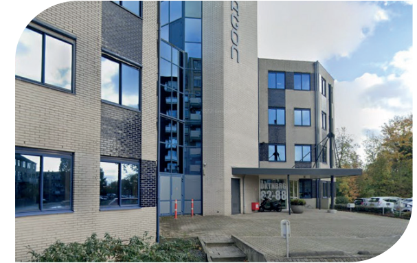
Het pand op de Dukatenburg in Nieuwegein.

Persoonlijke aandacht, elkaar helpen zowel privé als in het werk, hulp durven vragen en je richten op elkaars welbevinden. Dat zijn de bouwstenen om plezier te hebben en een optimale werksfeer te creëren.