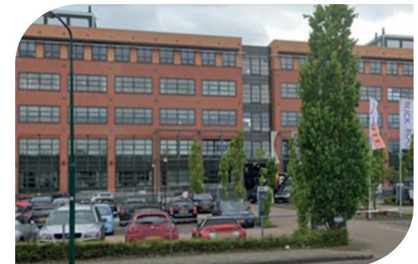
Het pand op de Zonnebaan in Maarssen waar Caesar in 2000 naar toe verhuisd.

Op basis van ons vakmanschap zullen we steeds meer uitdagende opdrachten aankunnen waardoor klanten zich verder kunnen ontwikkelen en we samen aan onze toekomst werken. We geloven dat technologie een motor is voor de ontwikkeling van organisaties. Als Caesar zijn we overtuigd dat de mens het verschil blijft maken.