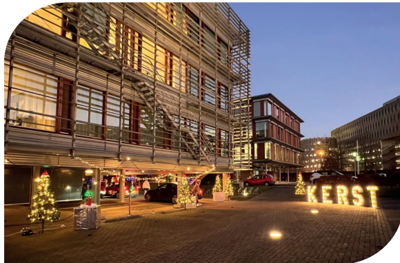
Geen groot kerstfeest, maar een drive-thru waar we toch samen kerst konden vieren.

Caesar Academy heeft voldoende mogelijkheden voor ontwikkeling en versterkt daarnaast de onderlinge betrokkenheid en verbinding tussen de business units.