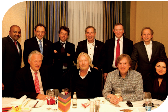
Richard Branson gaf een inspirerende sessie op de Big Improvement Day in 2009.