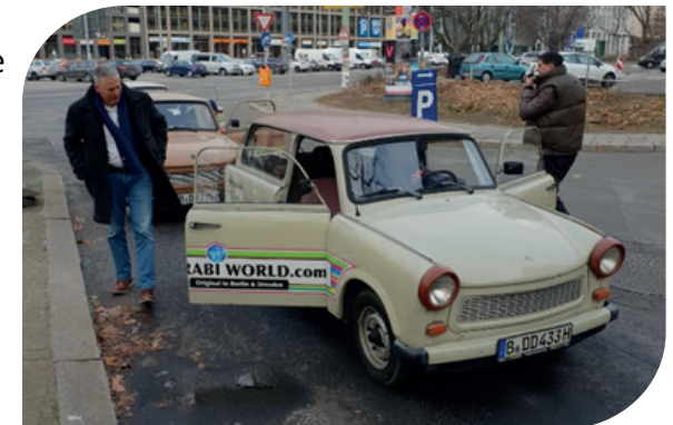
Met 25 klanten bivakkeren we 25 uur in Berlijn, waar we rondrijden in oude Trabantjes.

Qua cultuur worden medewerkers van SharedFlex geacht meer zelfstandig te opereren, waar dan ook een hogere beloning dan gemiddeld voor staat en wat zich vertaalt in een wat meer onafhankelijke en vrije cultuur waarbij de medewerker zelf aan het stuur staat.