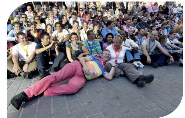
Alle Caesarianen in Lille voor het 12,5-jarig bestaan.

Na diverse wisselingen van technologieën en medewerkers is Experts geëvalueerd tot de dienstverlener in Progress (Open Edge / Corticon), JAVA, Oracle Apex/PL-SQL en DBA, en integratie (IRIS, Sonic, en ASB). Experts telt 23 vakmensen en is dagelijks hard (hybride) aan het werk voor haar klanten. Maandelijks zoeken de medewerkers elkaar op tijdens in de inhouse dagen bij Caesar in Utrecht.